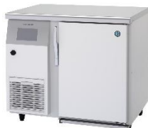
テーブル型 再加熱キャビネット